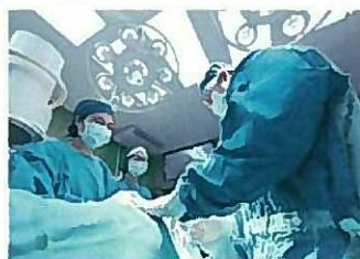
2次感染を防ぐ衛生水 として