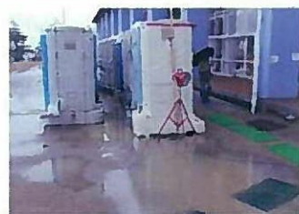
トイレの洗浄水として