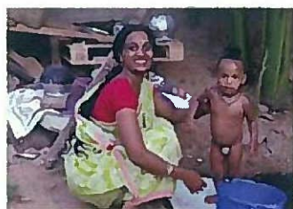
身体をふく清浄水、 洗濯水として